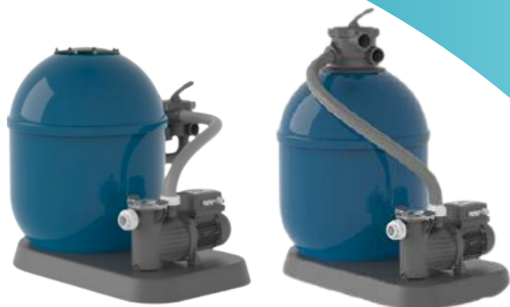
GFL montaje lateral