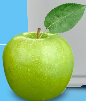
Fruta a tamaño real

Resina de alto rendimiento que permite mayor flujo de agua descalcificada.